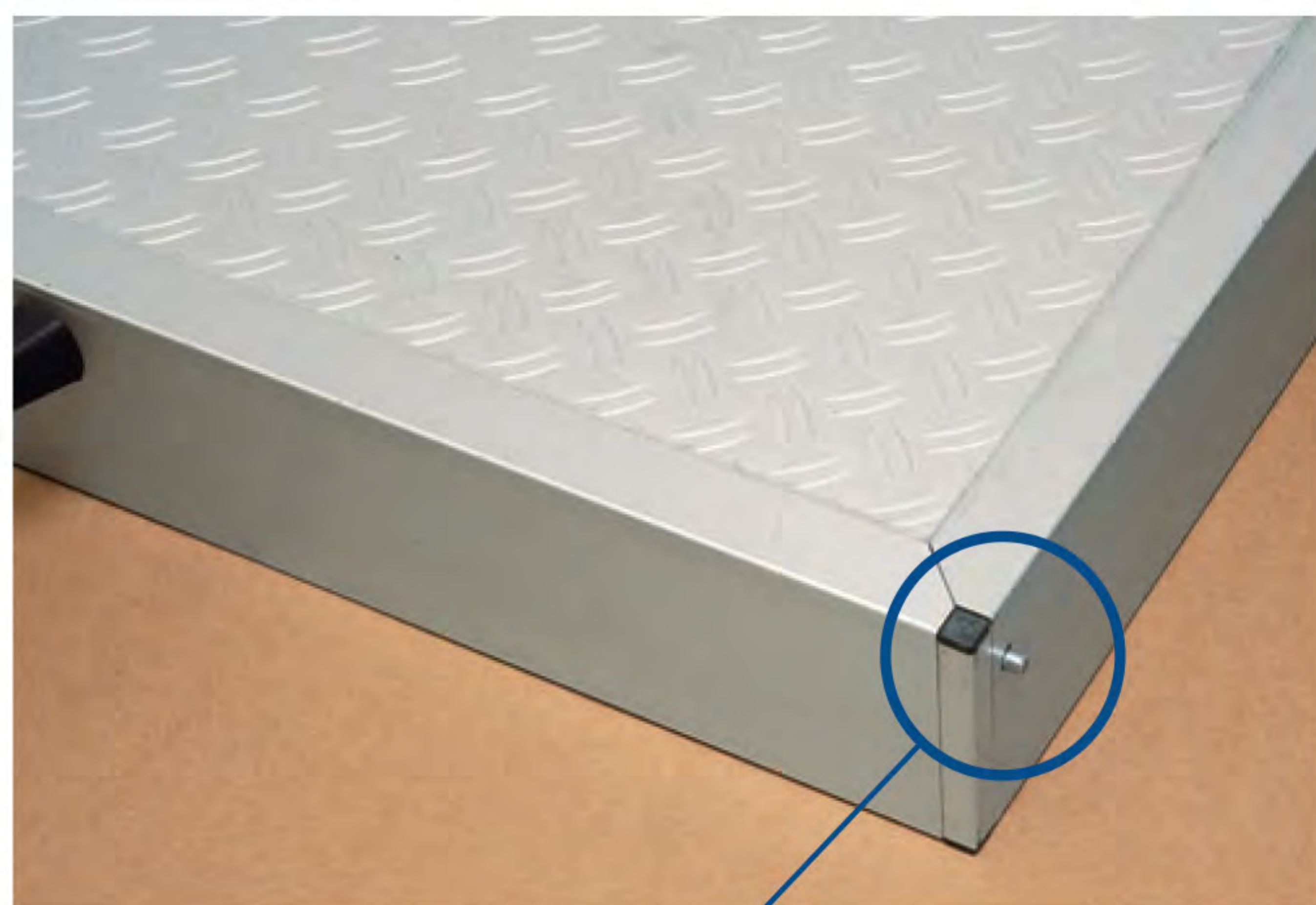
Il sistema di chiusura laterale del cassetto

I cassetti possono essere fissati ai principali sistemi scorrevoli disponibili sul mercato a scelta e cura del cliente.